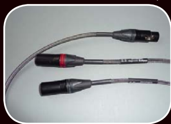
Magic-Link Eclipse XLR<--->XLR 50cm € 260,-