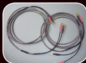
Speakerkabel 2x200cm € 460,-