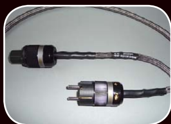
Power-Cord 150cm € 360,-