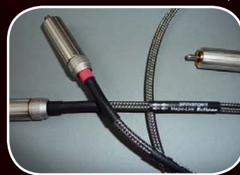
Magic-Link Eclipse RCA<--->RCA 50cm € 260,-